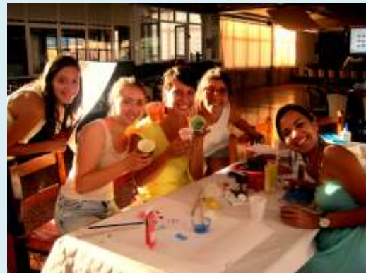
Bei den Vorbereitungen für ein Kinder-Sommer-Programm